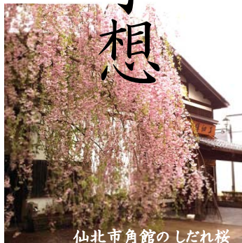
仙北市角館のしだれ桜